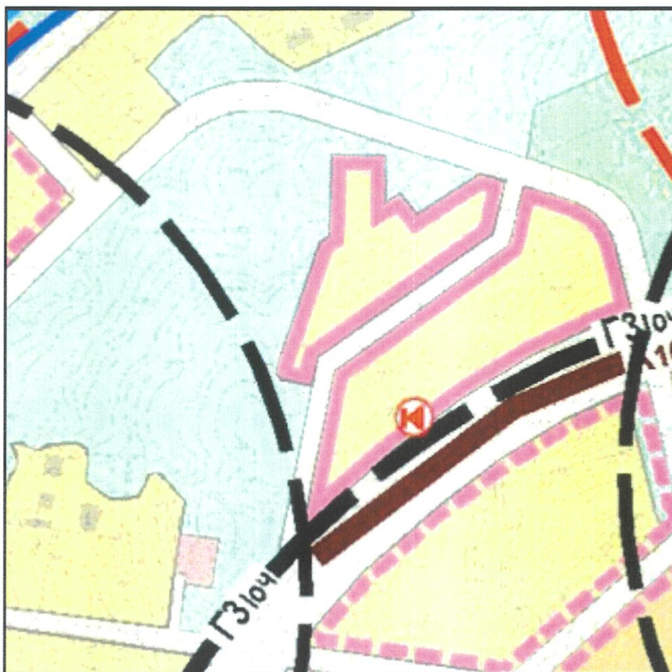
Схема границ зон с особыми условиями использования территории г. Миасс Правил землепользования и застройки Миасского городского округа (фрагмент) с учётом изменений видов и границ территориальных зон в отношении территории, расположенной в г. Миассе, ул. Пушкина, участок 7 (74:34:2005062:57)

ТЕРРИТОРИИ, ПОДВЕРЖЕННЫЕ РИСКУ ВОЗНИКНОВЕНИЯ ЧС ТЕХНОГЕННОГО ХАРАКТЕРА