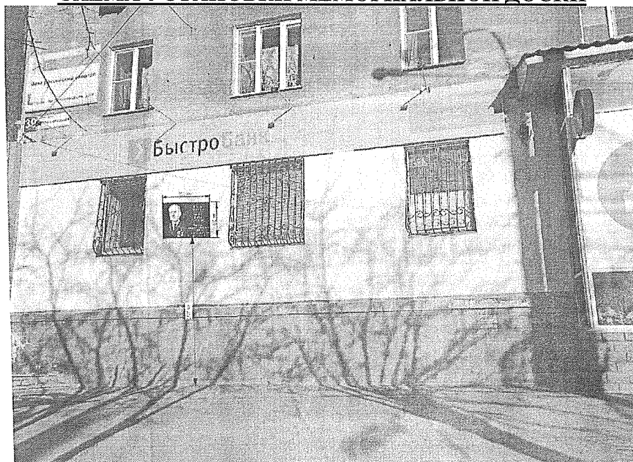
СХЕМА УСТАНОВКИ МЕМОРИАЛЬНОЙ ДОСКИ

Инициатор установки: АО «АЗ «УРАЛ». Расположение: г. Миасс, пр. Автозаводцев, 39 Размер мемориальной доски: 800мм x 600мм Материал: гранит габбро.