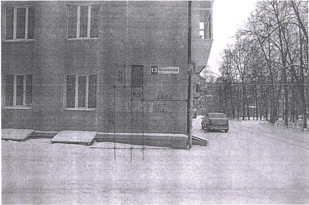
СХЕМА УСТАНОВКИ МЕМОРИАЛЬНОЙ ДОСКИ